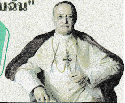
สมเด็จพระสันตะปาปาปิโอที่ 11

โอกาสฉลองครบรอบ 180 ปี ของสมณองค์กรยุทธธรรมทูต